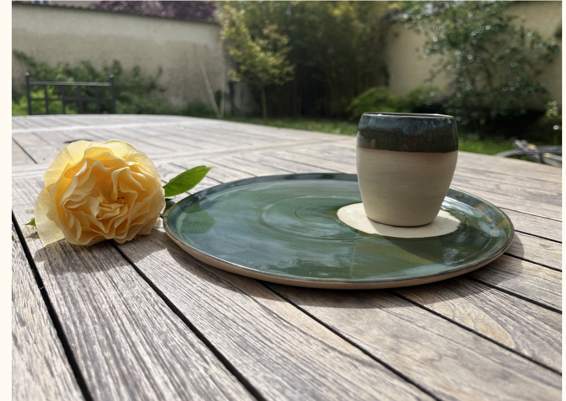
Grande assiette - plat 22€ D 26 cm