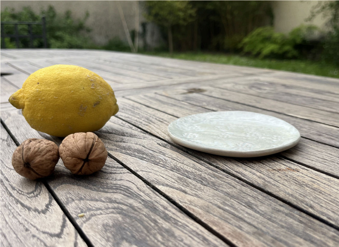
Assiette dessert brodée 10€ D 16 cm