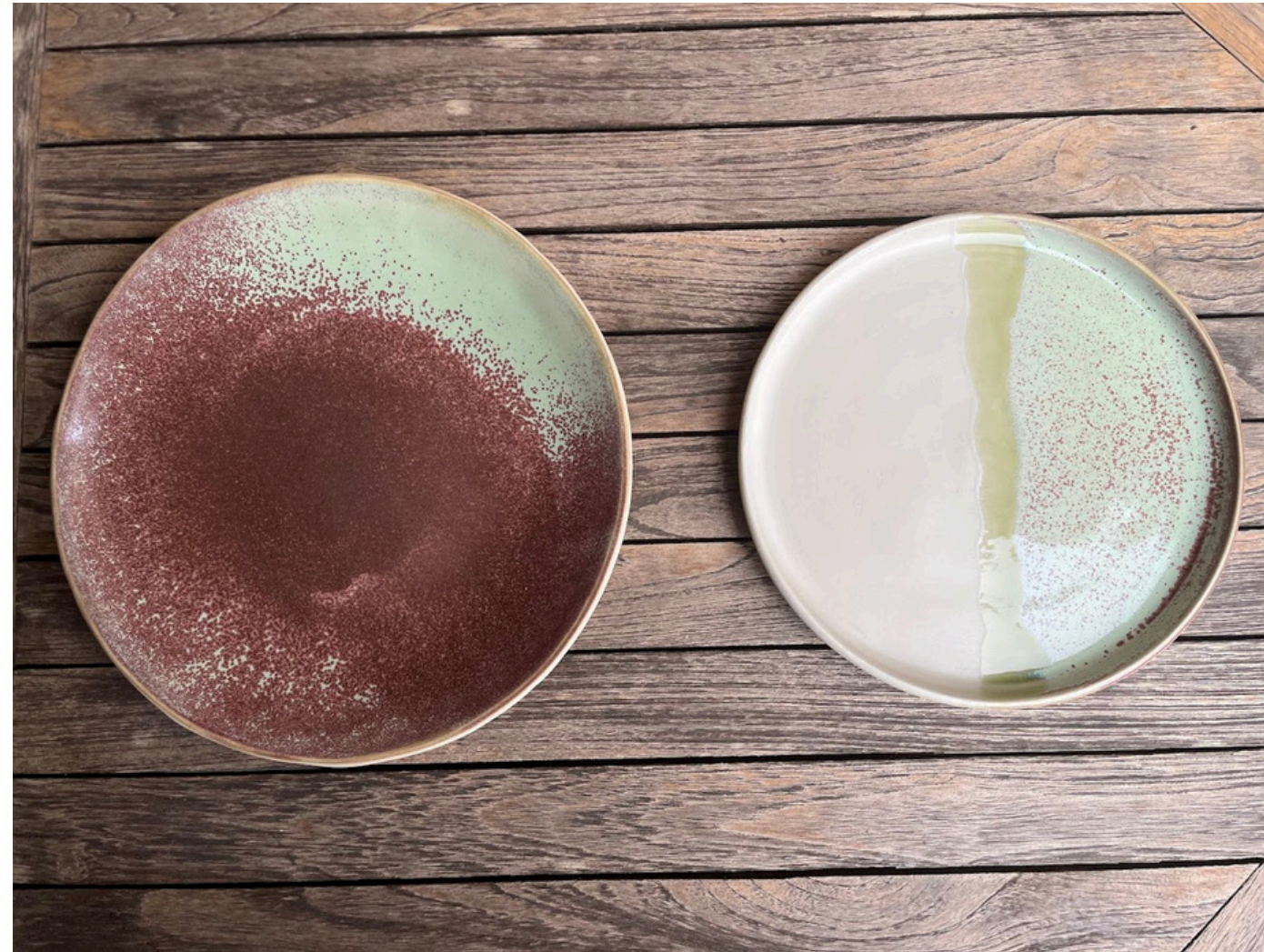
Grande assiette - plat 22€ D 26 cm