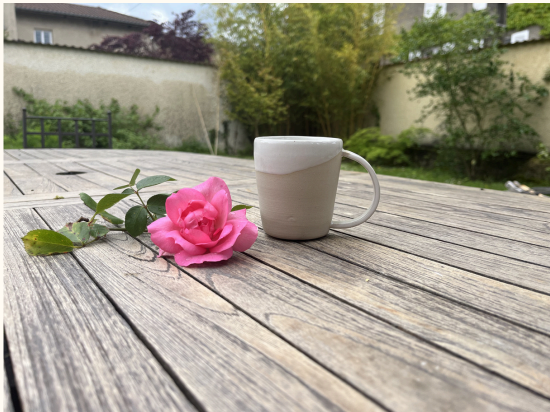
Tasse espresso avec anse 12€ H 6 cm