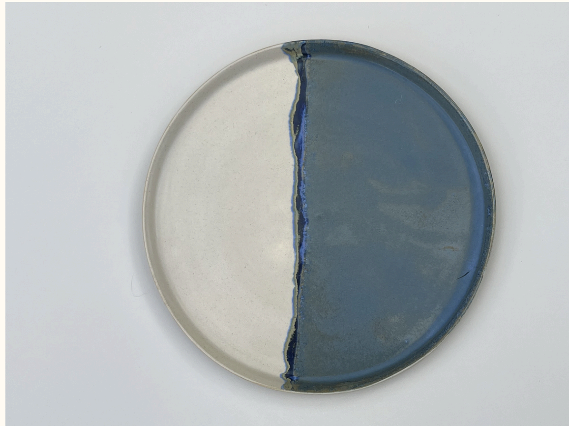
Assiette 18€ D 23 cm