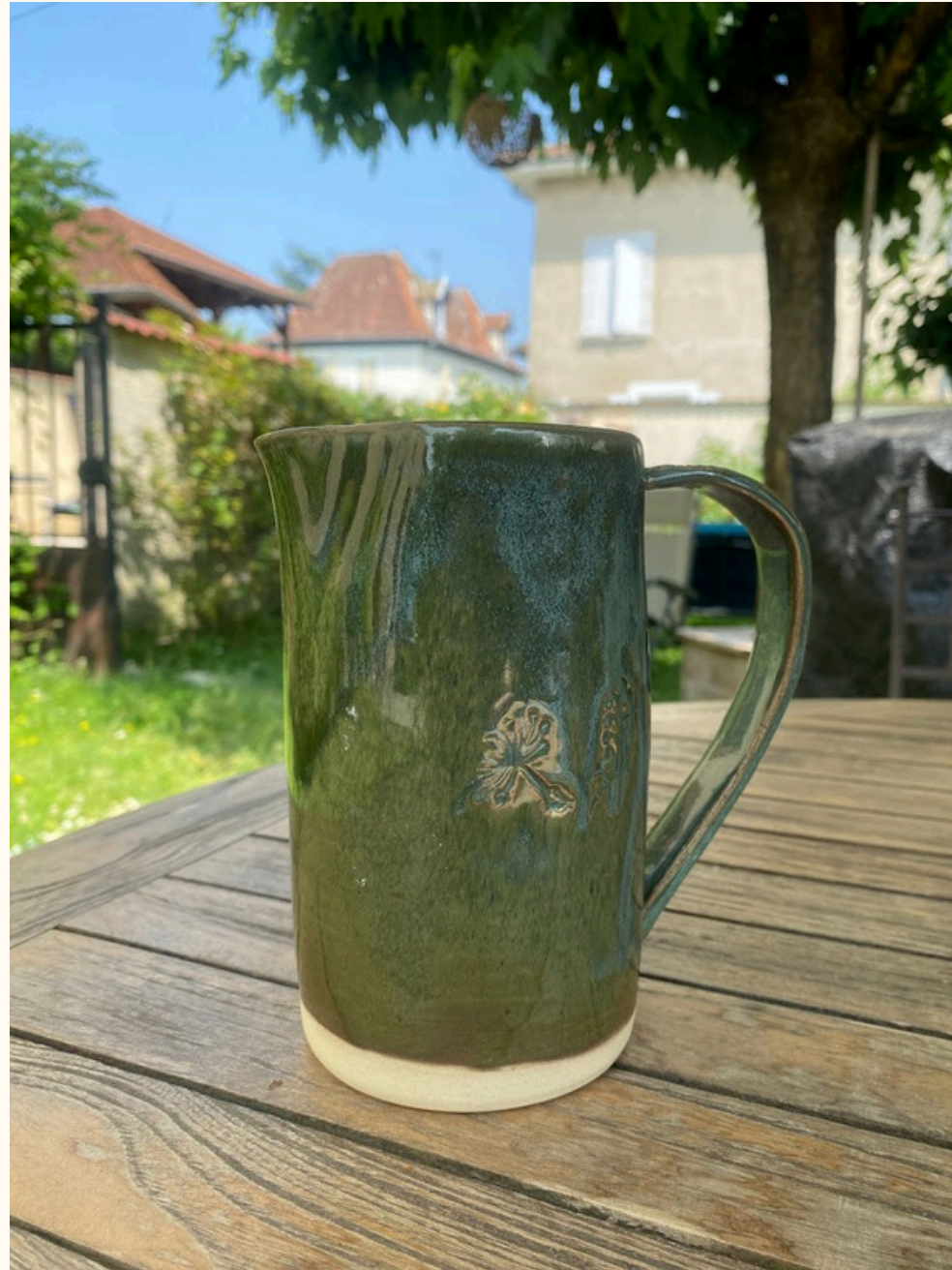
Pichet 30€ H 15 cm ou 17 cm