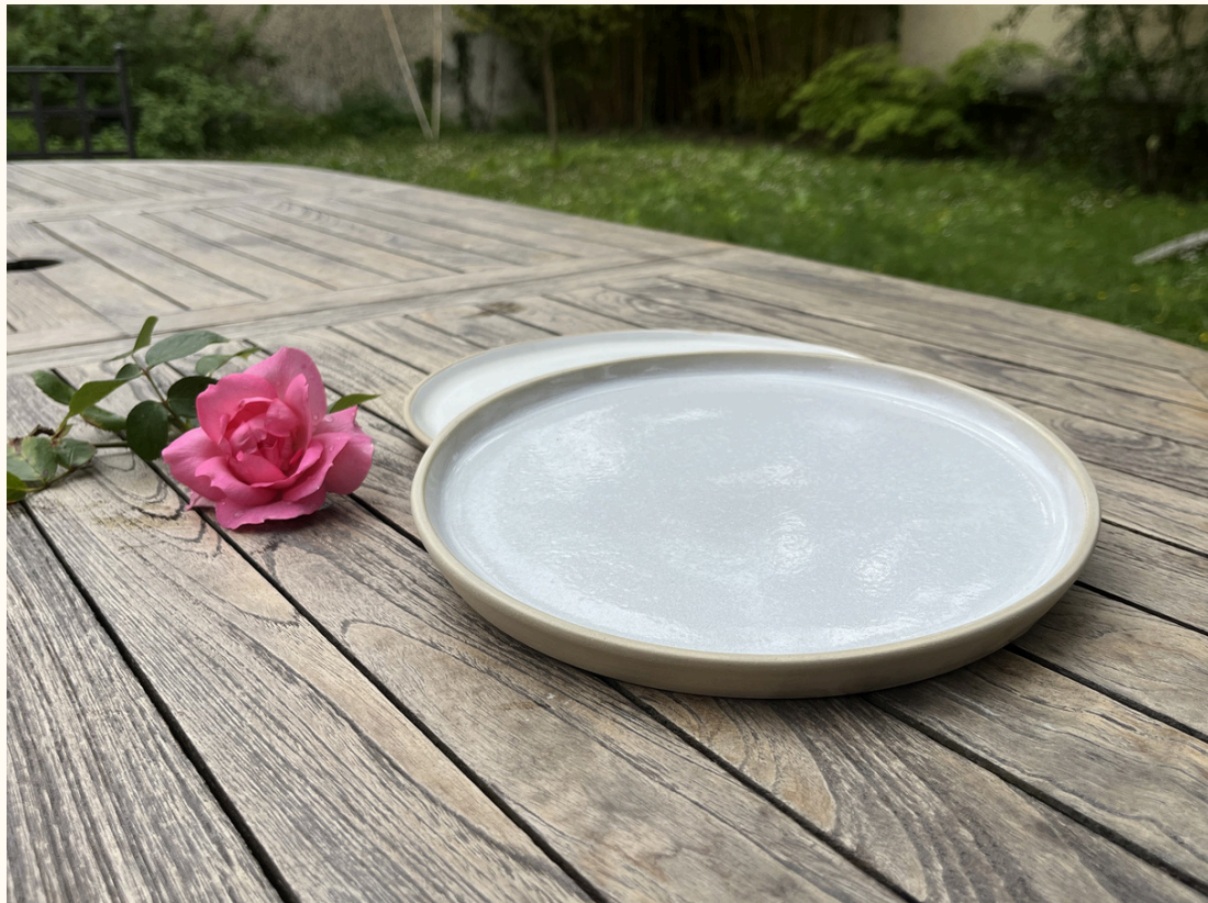
Assiette 18€ D 23 cm