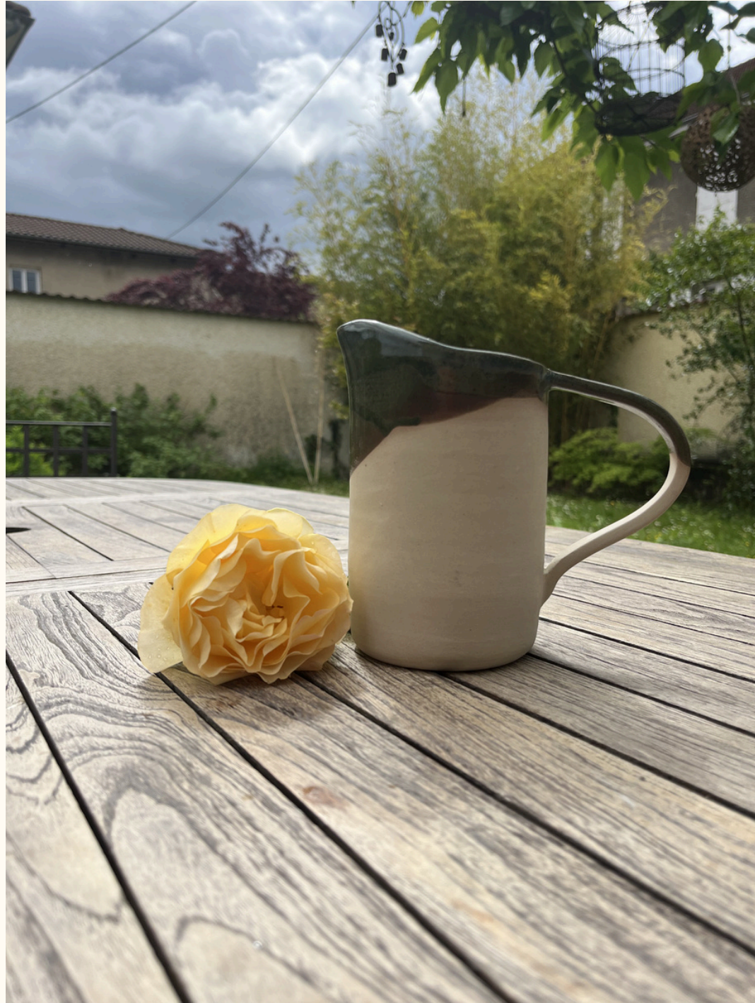
Pichet 30€ H 15 cm ou 17 cm