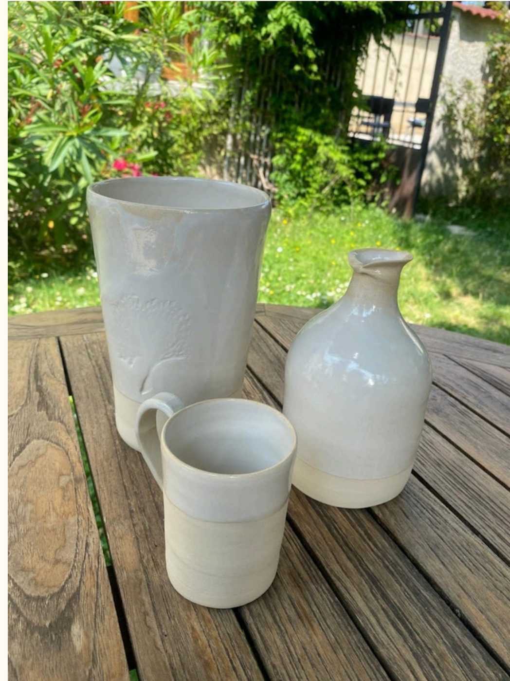
Vase & bouteille 30€