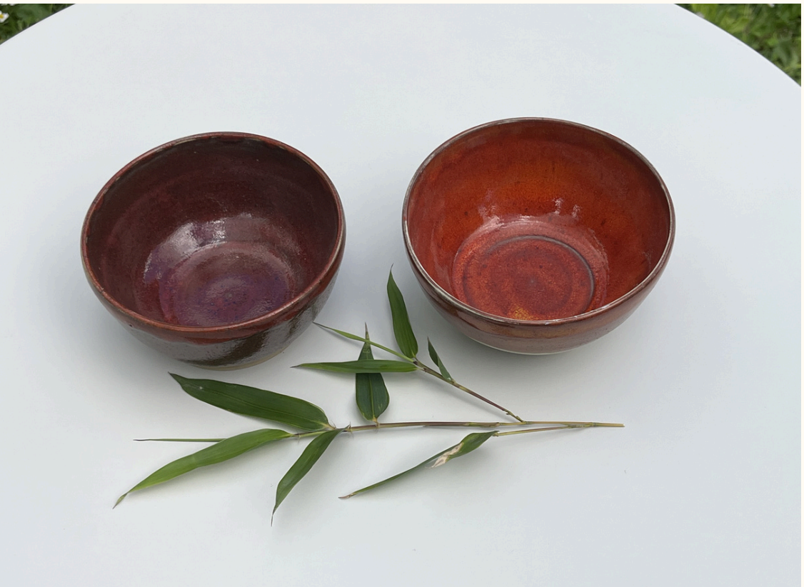
Petit bol 14€ Assiette 18€ D 10 cm D 23 cm