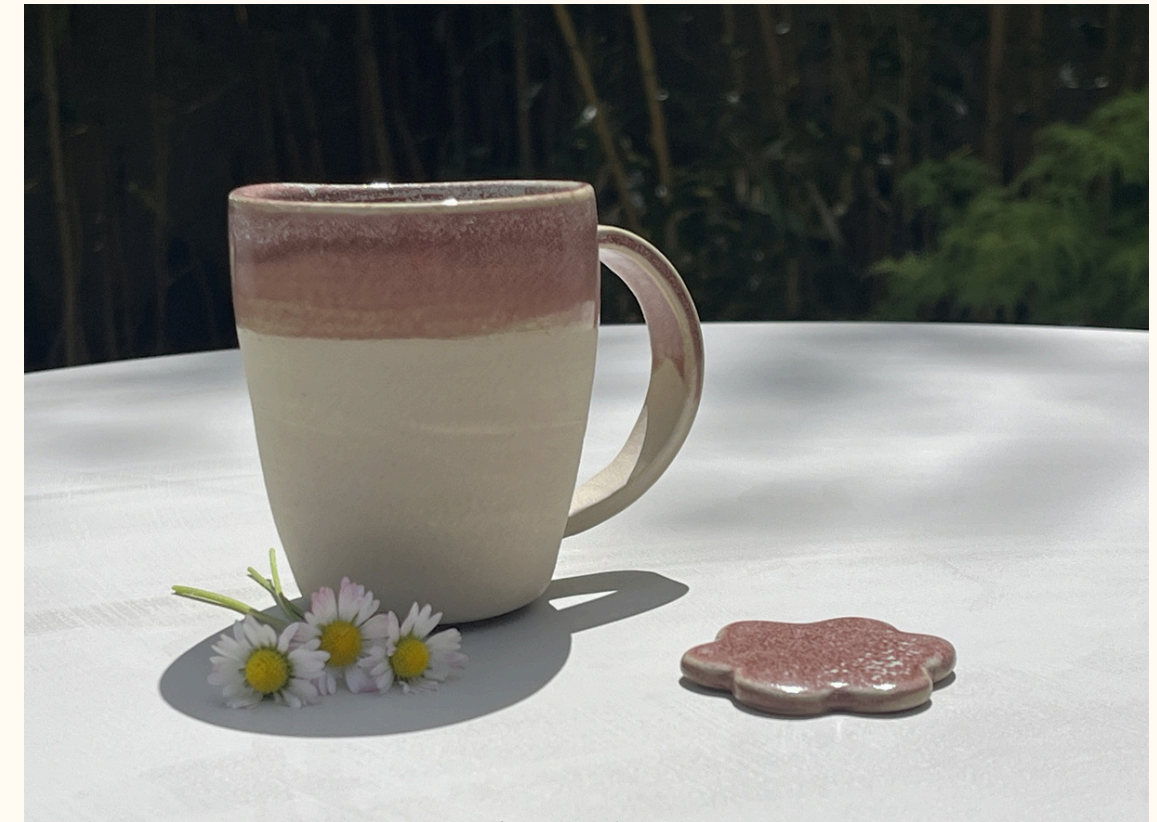
Tasse double espresso avec anse 14€ H 8 cm