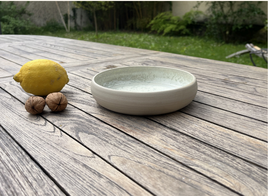
Petite assiette arrondie 18€ D 17 cm