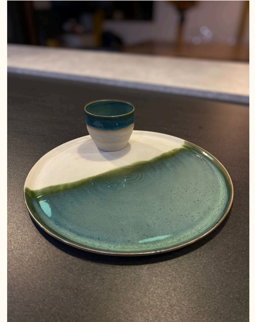
Assiette 18€ D 23 cm