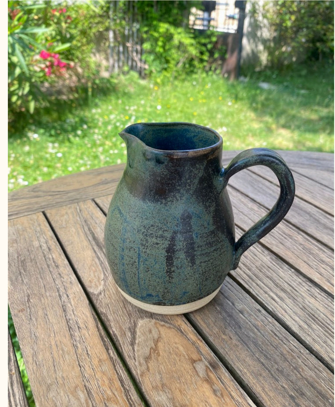
Petit pichet arrondie 20€ H 25 cm