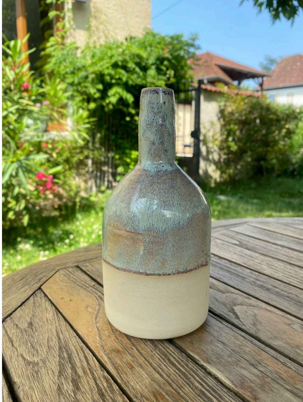
Grande bouteille 30€