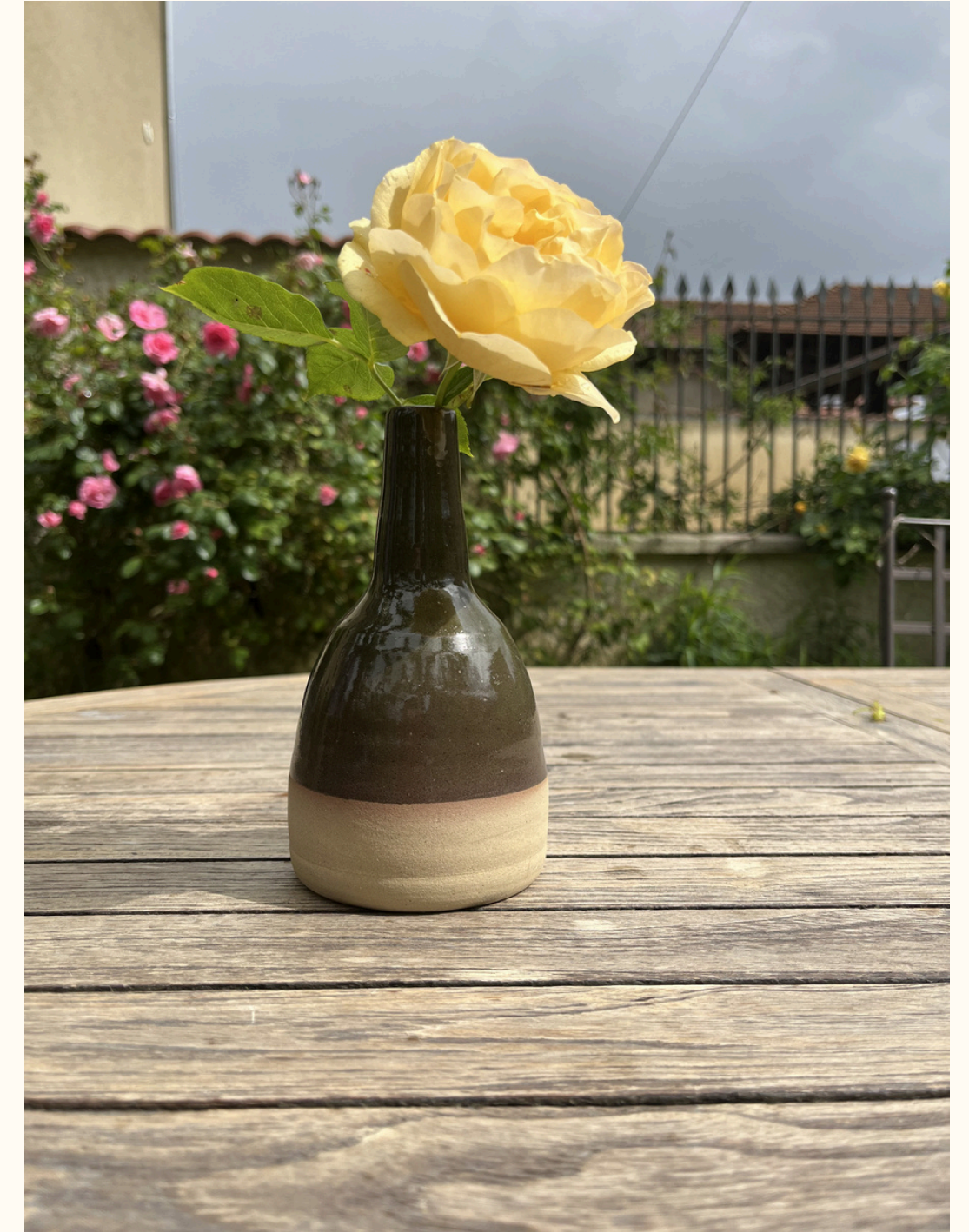
Petite bouteille 25€ H 16 cm