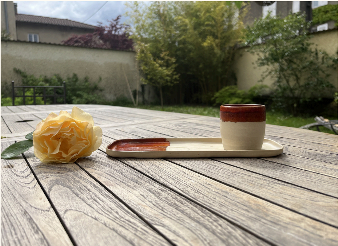
Repose cuillère-petit plat rectangulaire 14€ L 25 cm