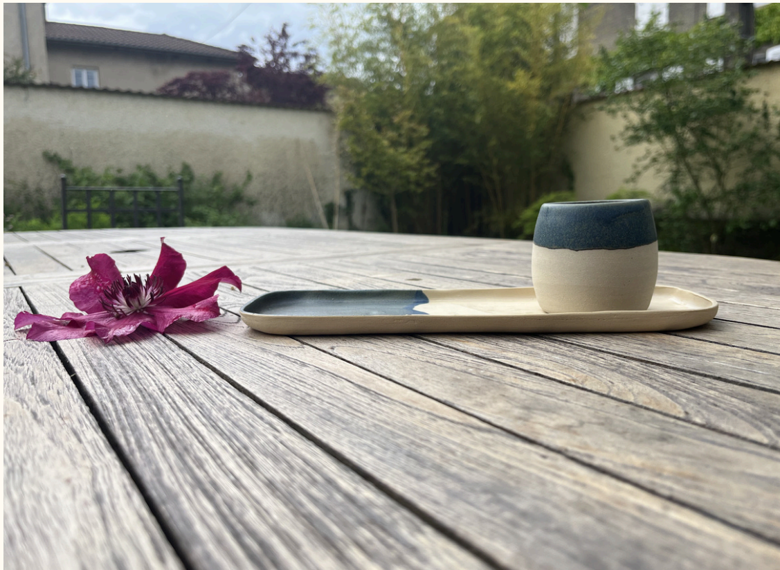
Repose cuillère-petit plat rectangulaire 14€ L 25 cm