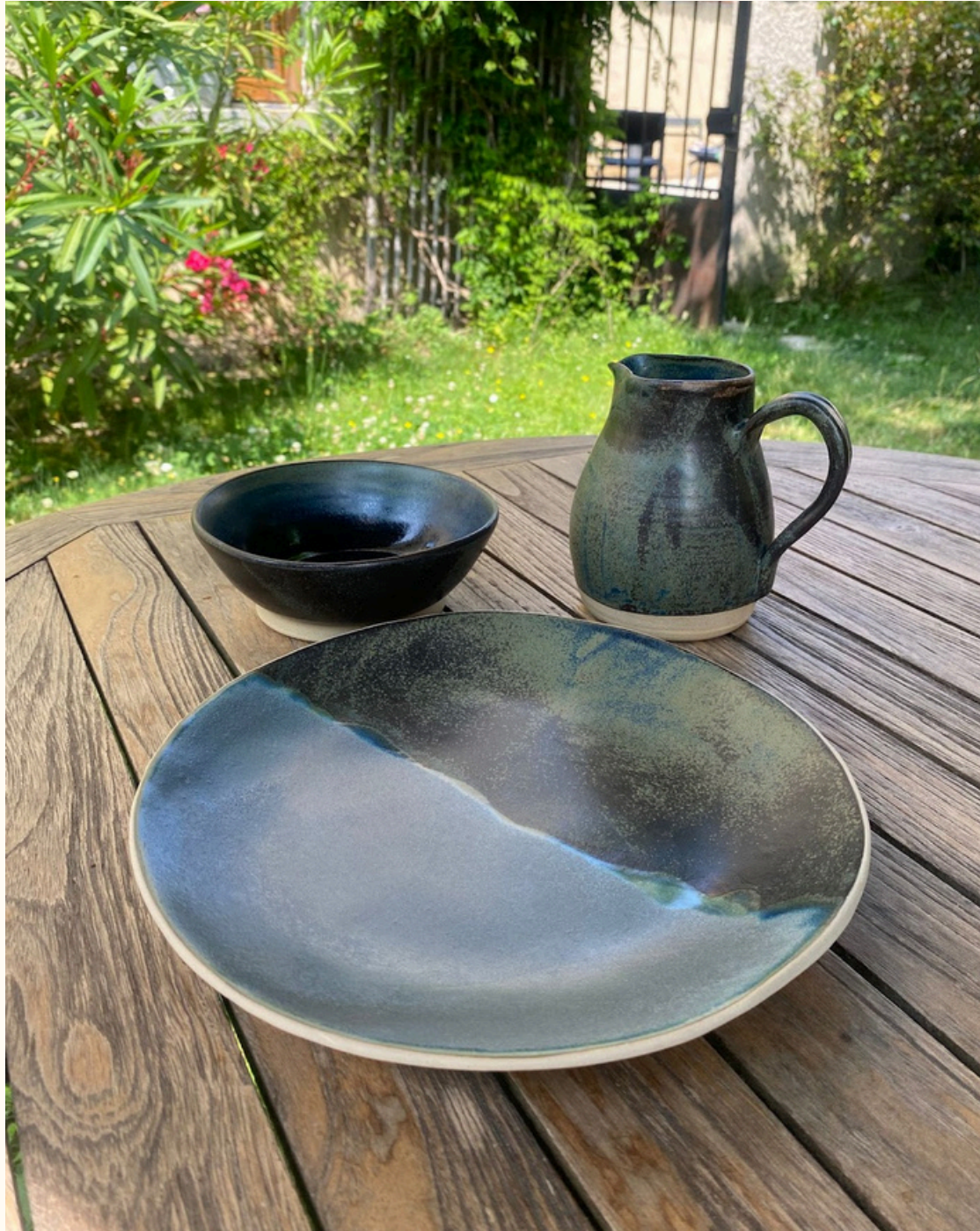
Grande assiette - plat 22€ D 26 cm