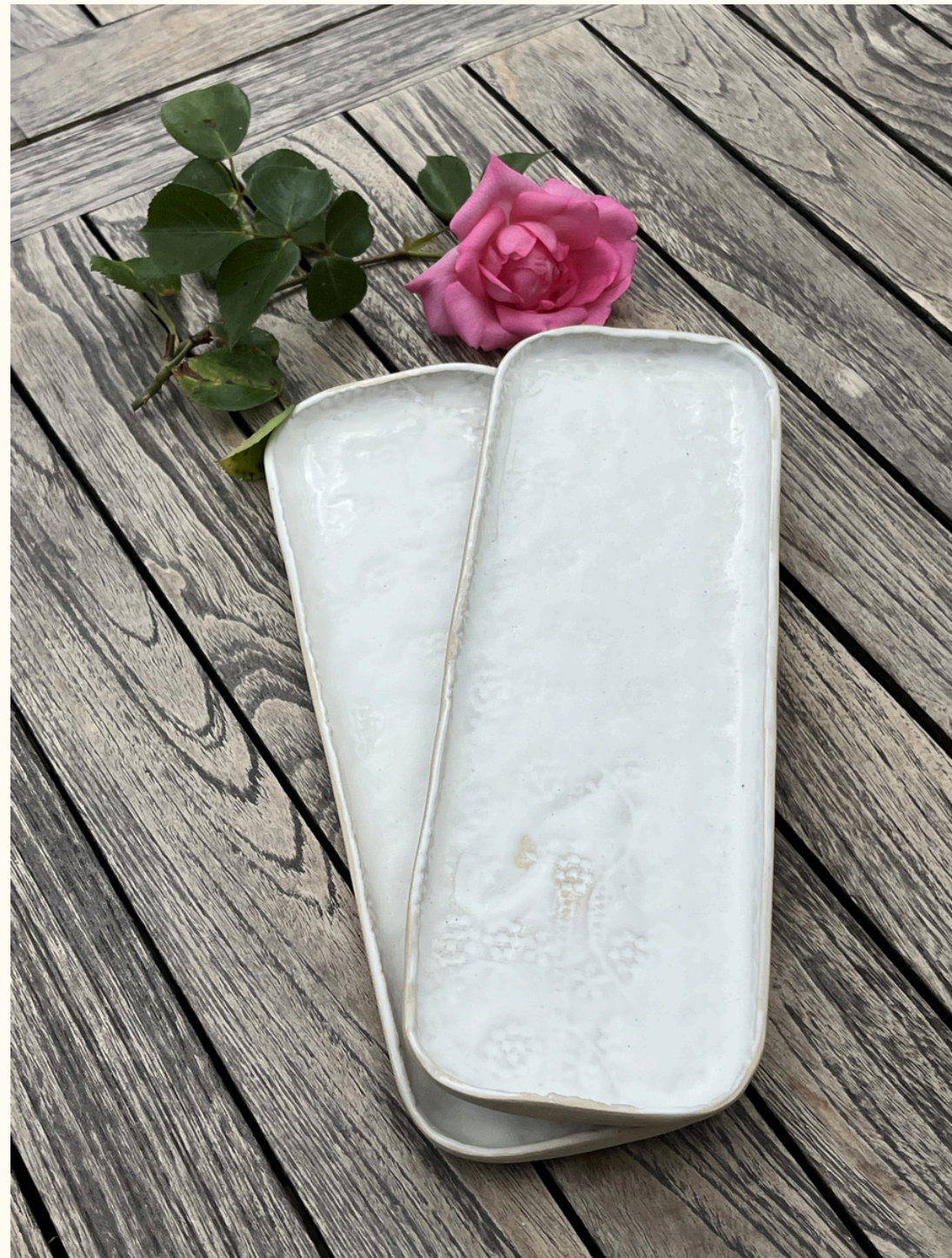
Repose cuillère-petit plat rectangulaire 14€ L 25 cm