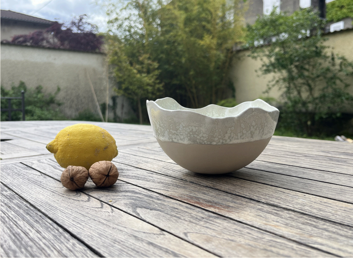
Petit saladier 20€ D 15 cm