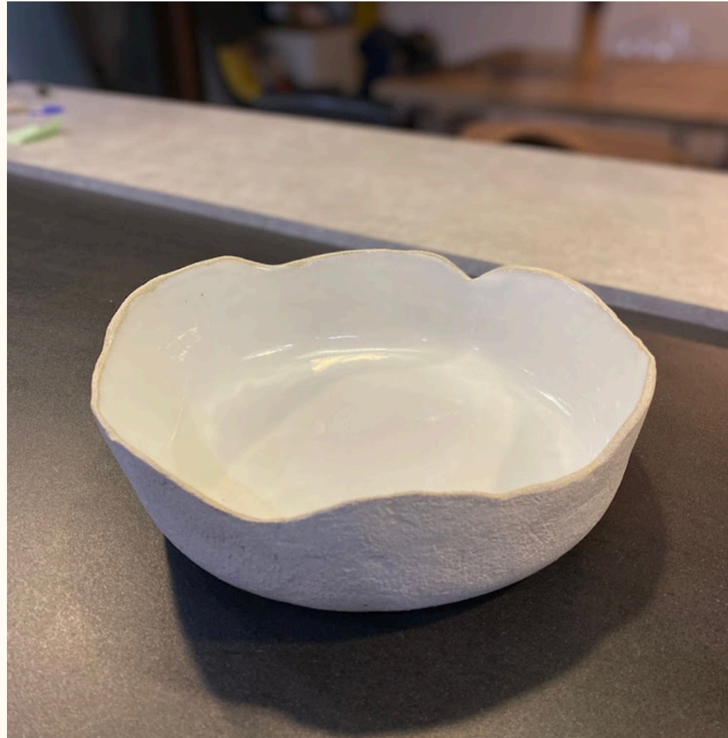
Saladier 35€ D 26 cm