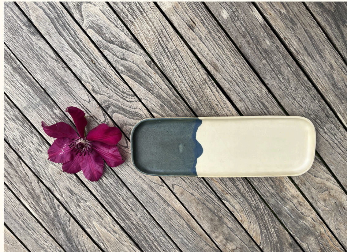
Tasse double espresso avec anse 14€ H 8 cm