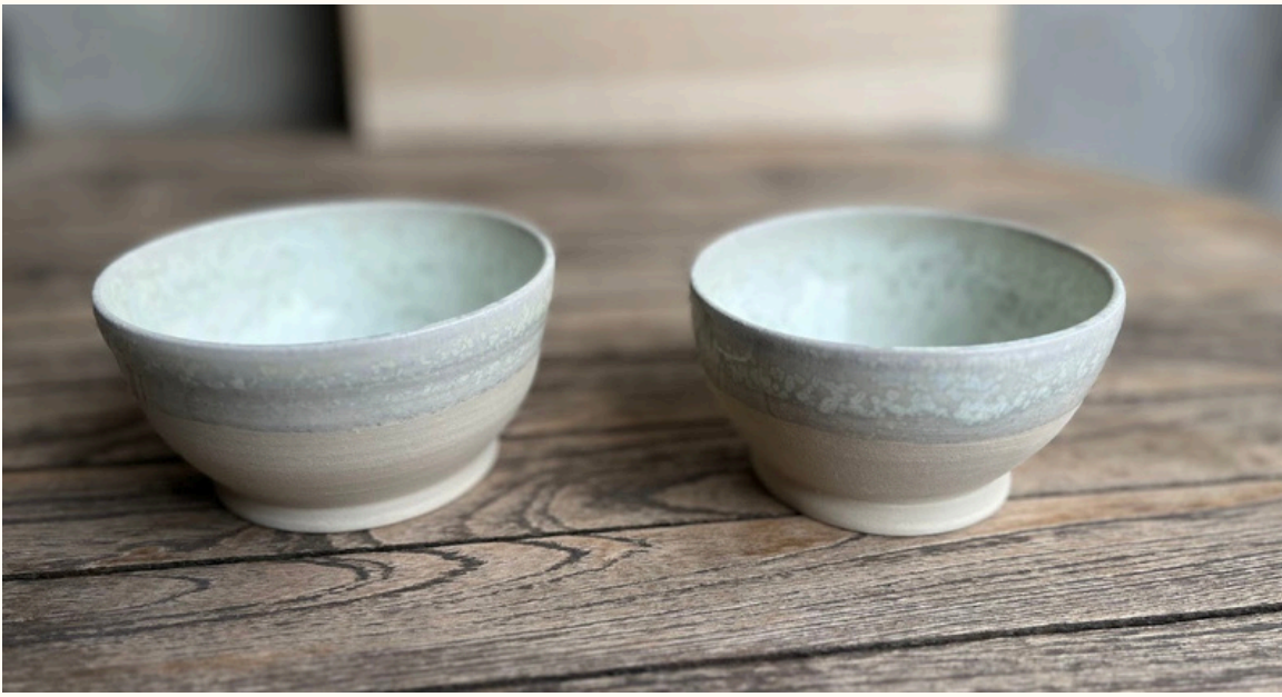
Petit bol 14€ D 10 cm