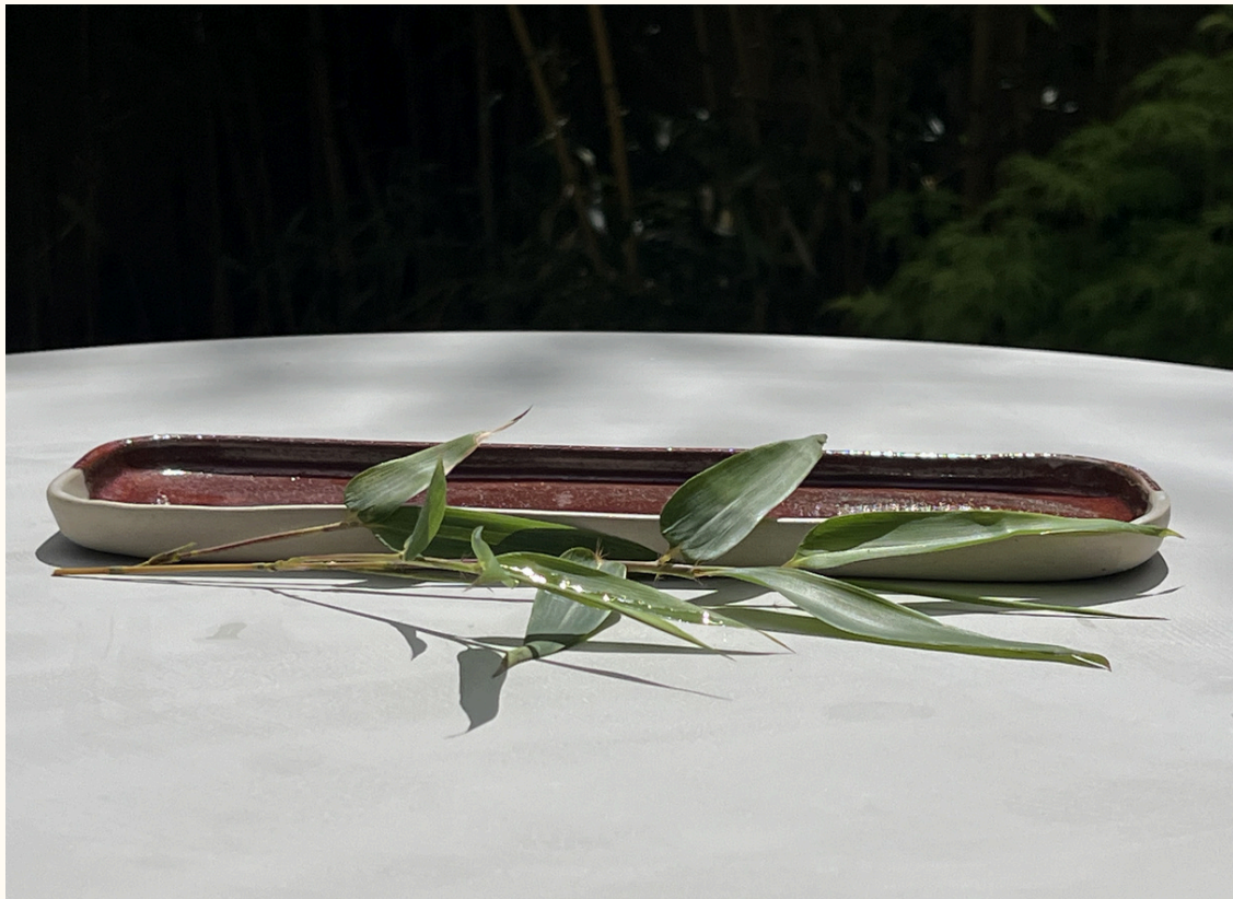
Repose cuillère-petit plat rectangulaire 14€ L 25 cm