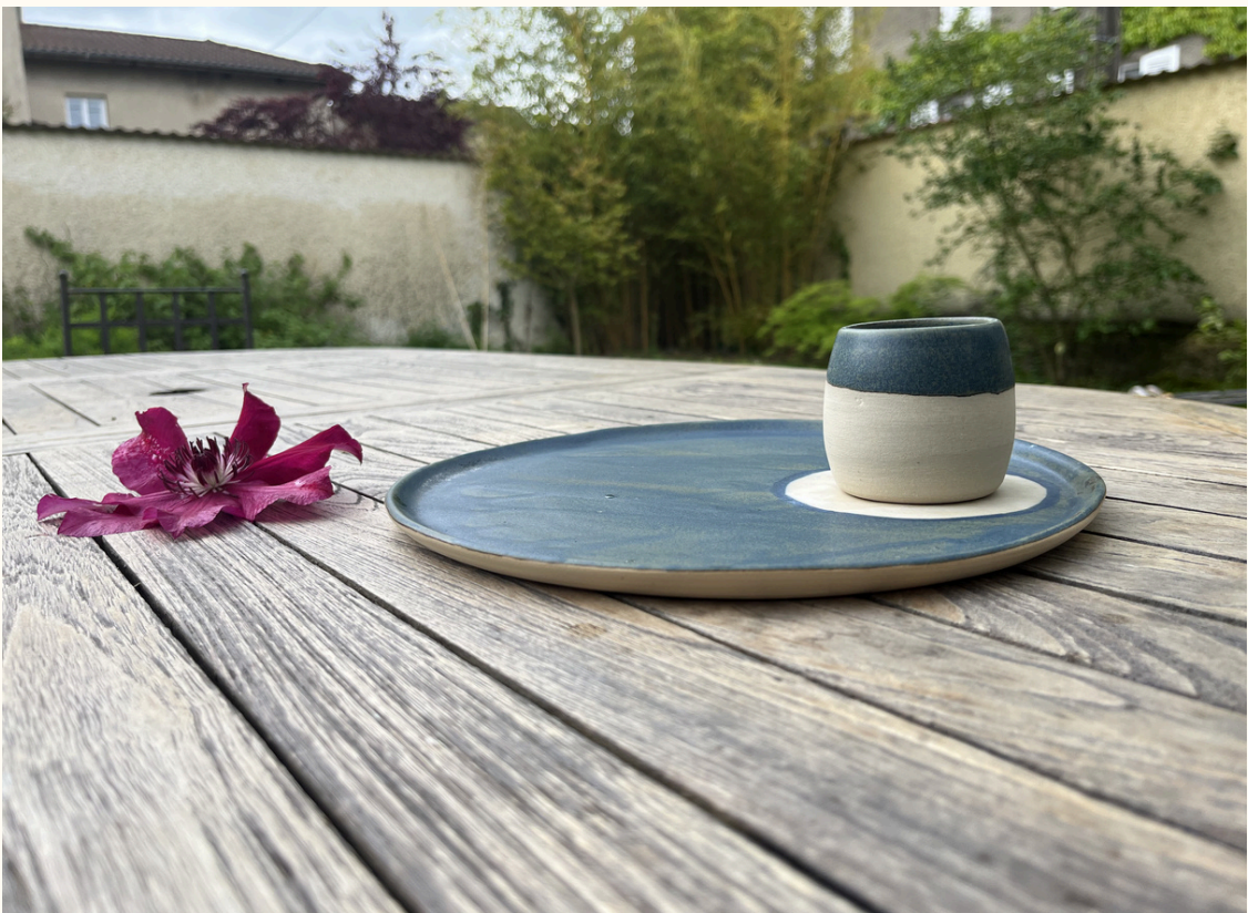
Tasse expresso sans anse 10€ H 6 cm