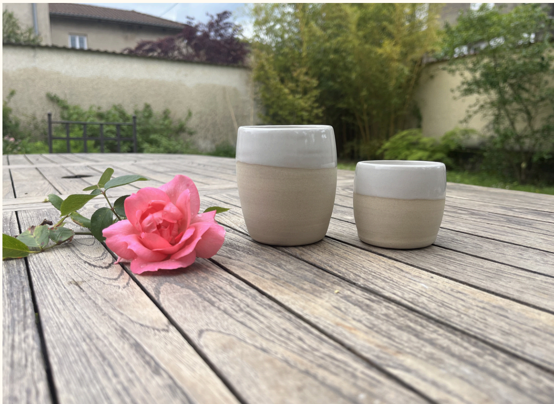
Tasse double espresso sans anse 12€ H 8 cm