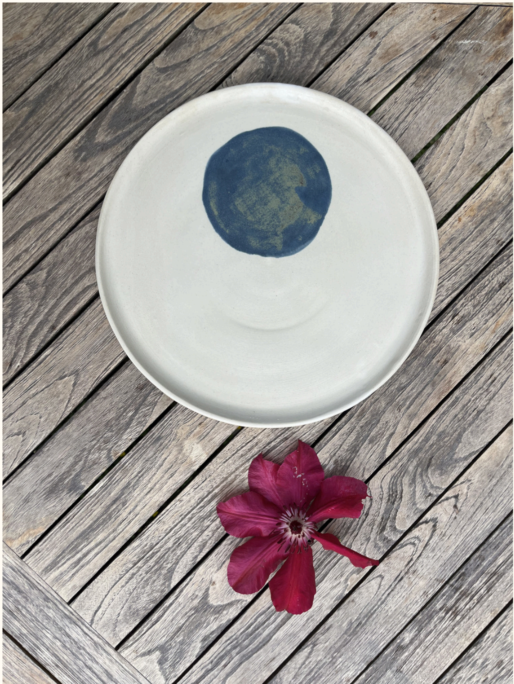
Grande assiette - plat 22€ D 26 cm