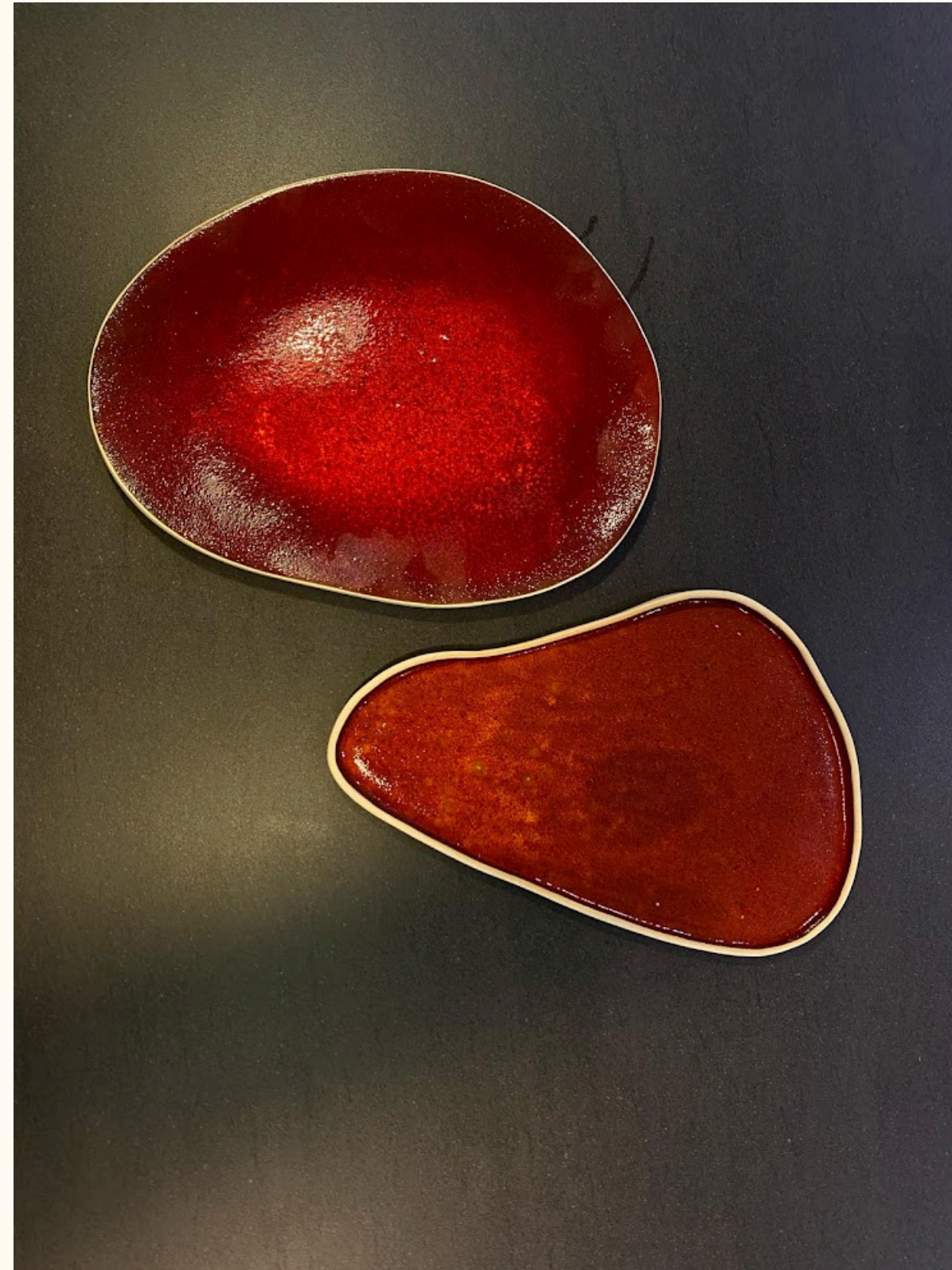
Grande assiette - plat 22€ D 26 cm