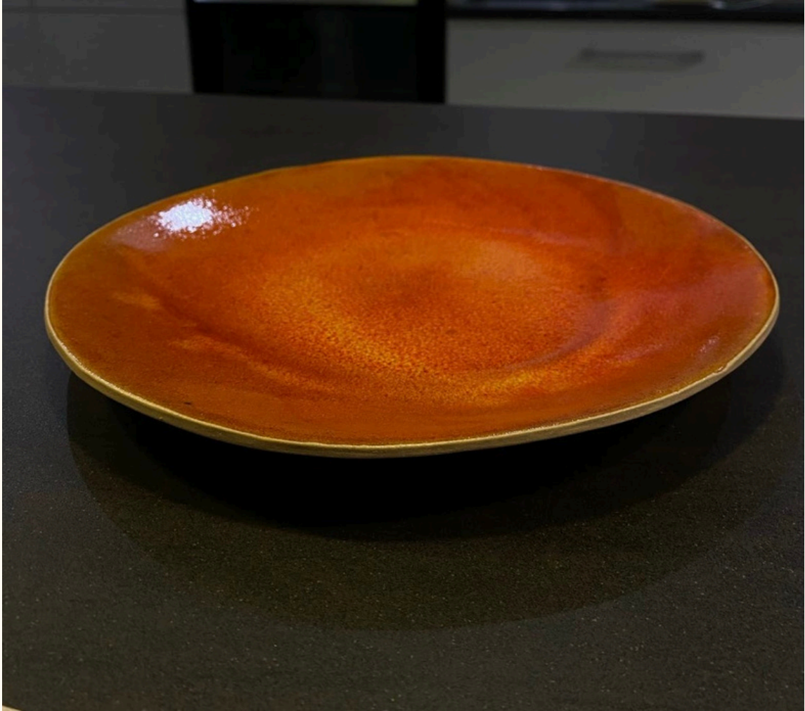
Grande assiette - plat 22€ D 26 cm Assiette allongée 18€