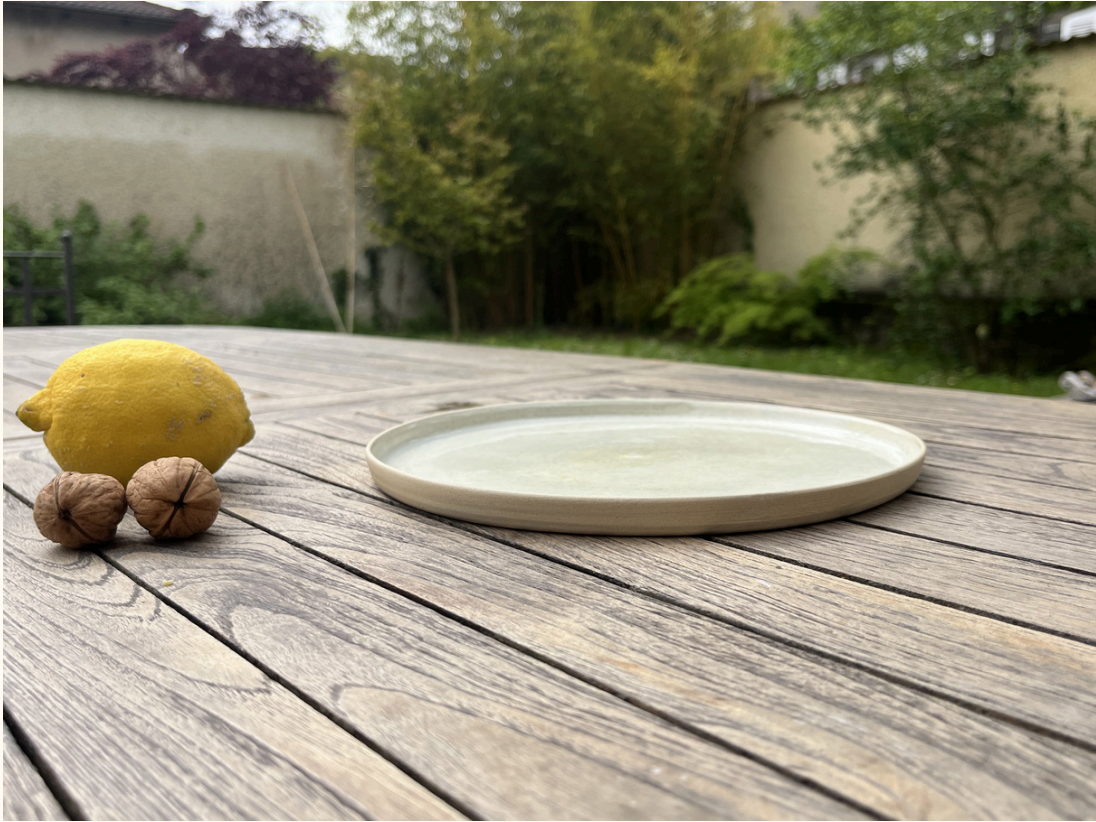
Assiette 18€ D 23 cm