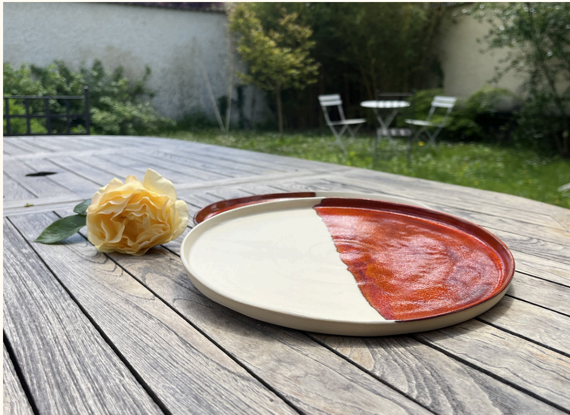
Assiette 18€ D 23 cm