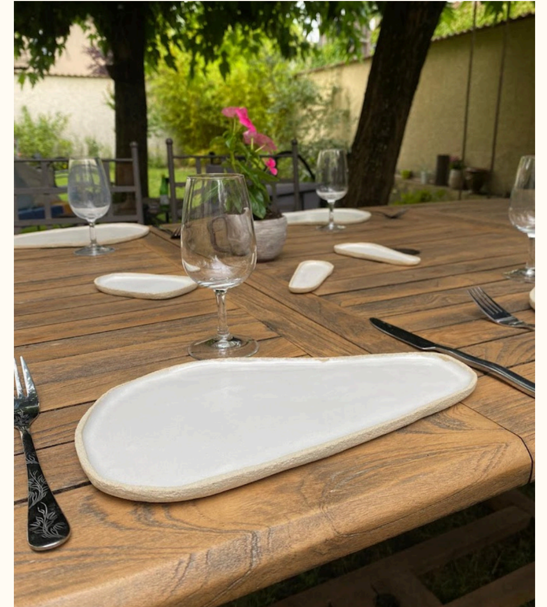
Assiette allongée chamottée 18€