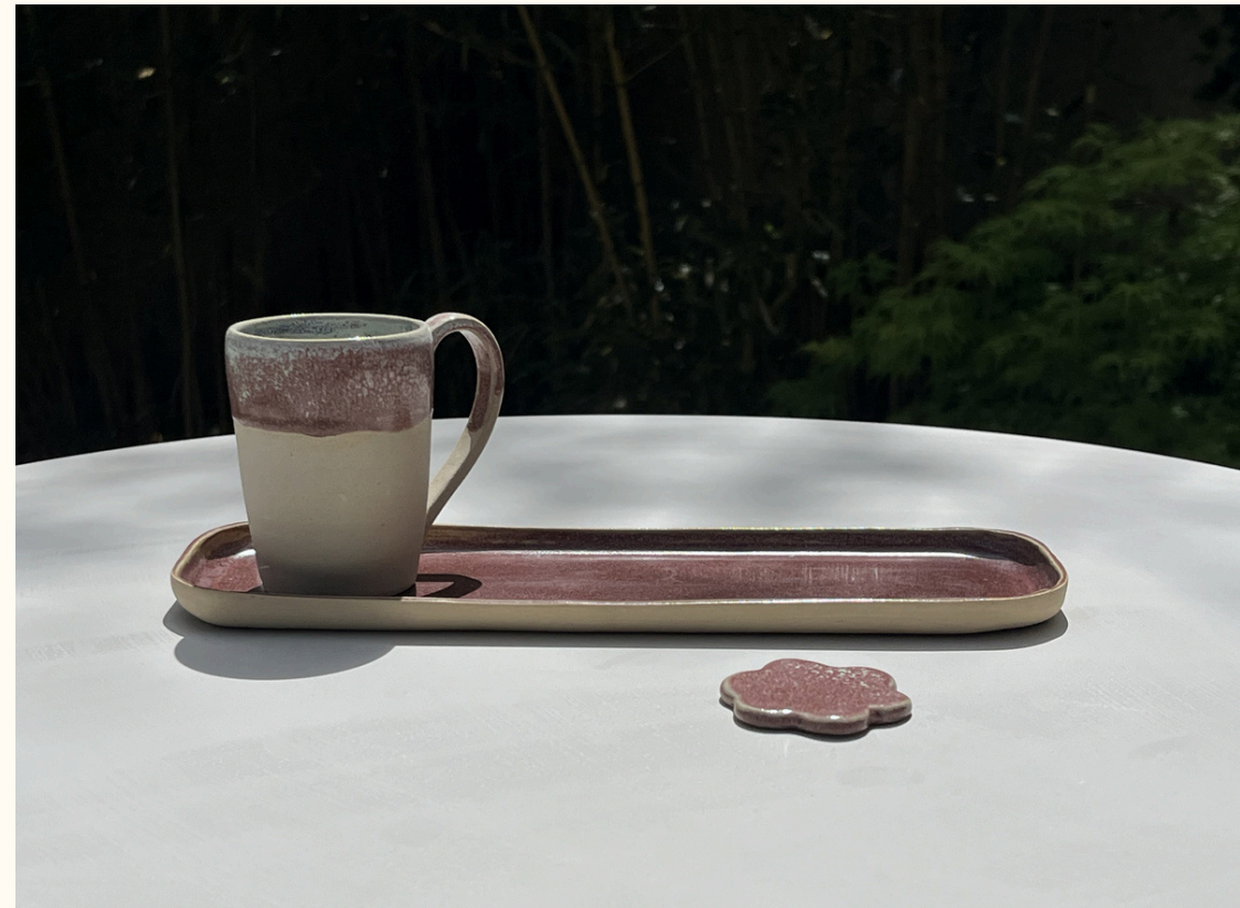
Repose cuillère-petit plat rectangulaire 14€ L 25 cm