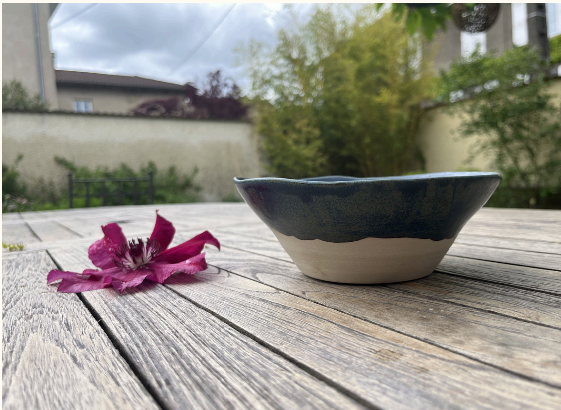
grand bol - petit saladier 18€ D 17 cm