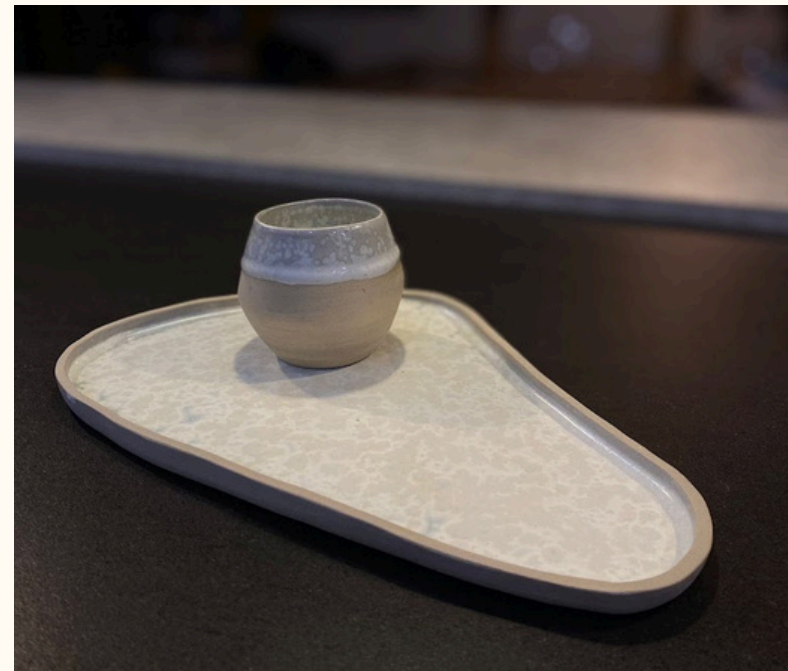
Assiette allongée 18€