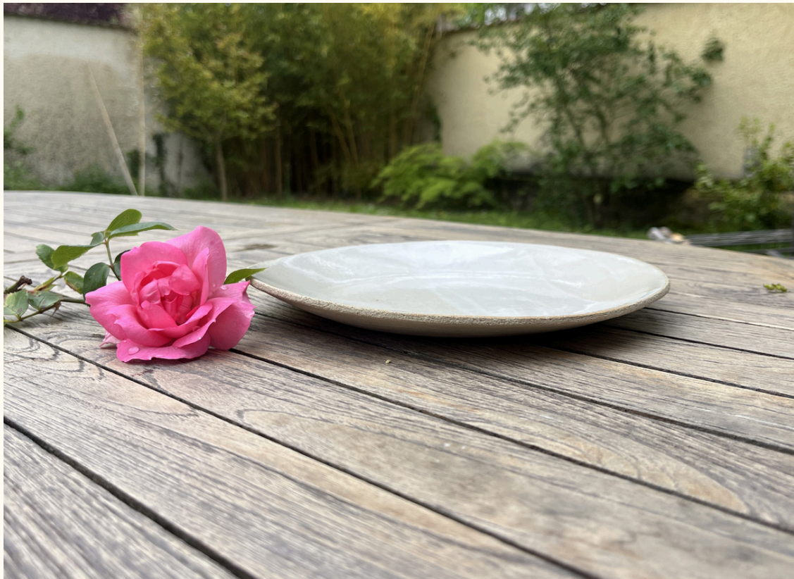
Assiette 16€ D 22 cm