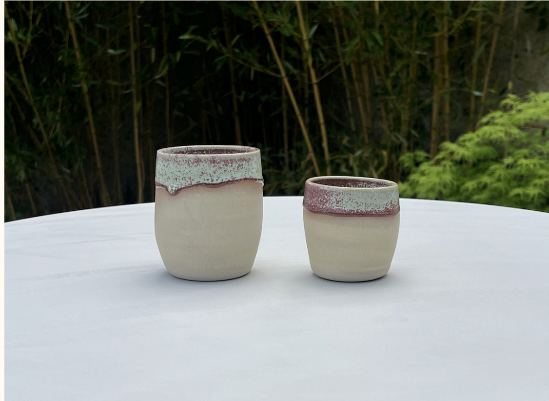
Tasse double espresso sans anse 12€ H 8 cm