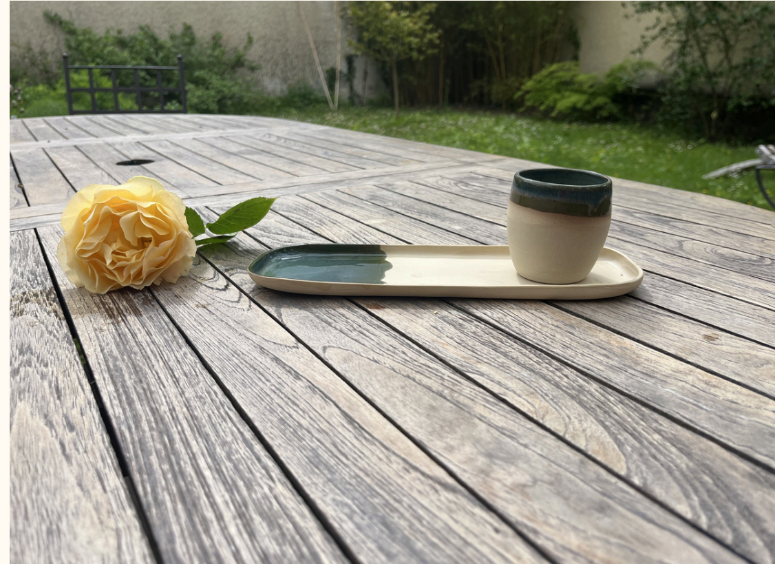
Repose cuillère-petit plat rectangulaire 14€ L 25 cm