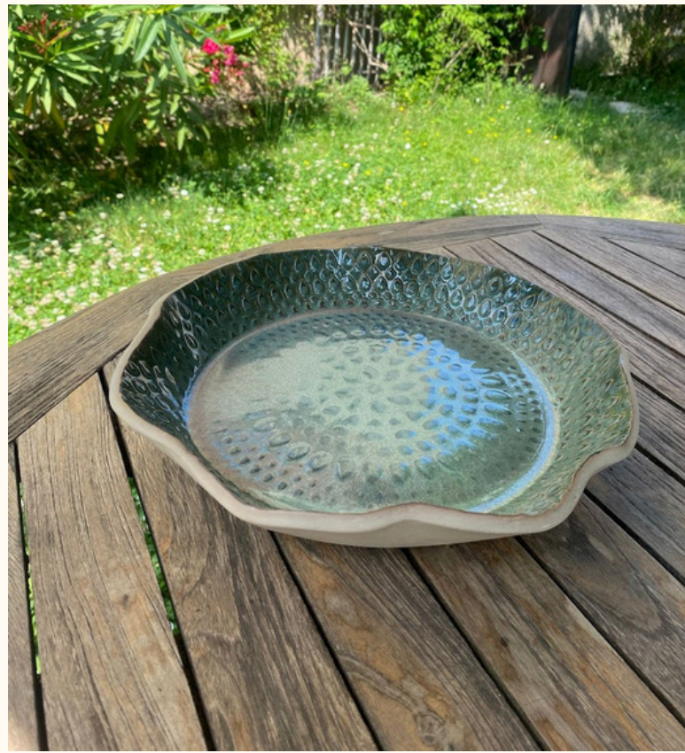
Saladier 35€ D 26 cm