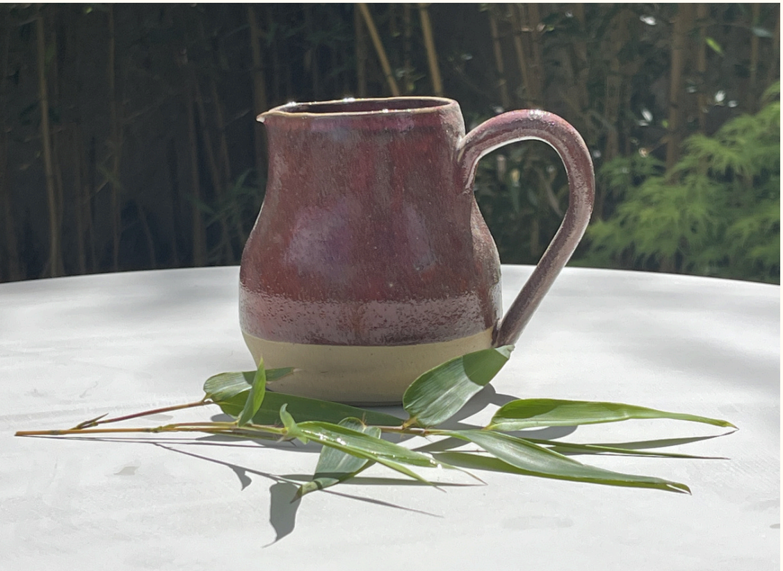
Petit pichet arrondie 25€ H 11 cm