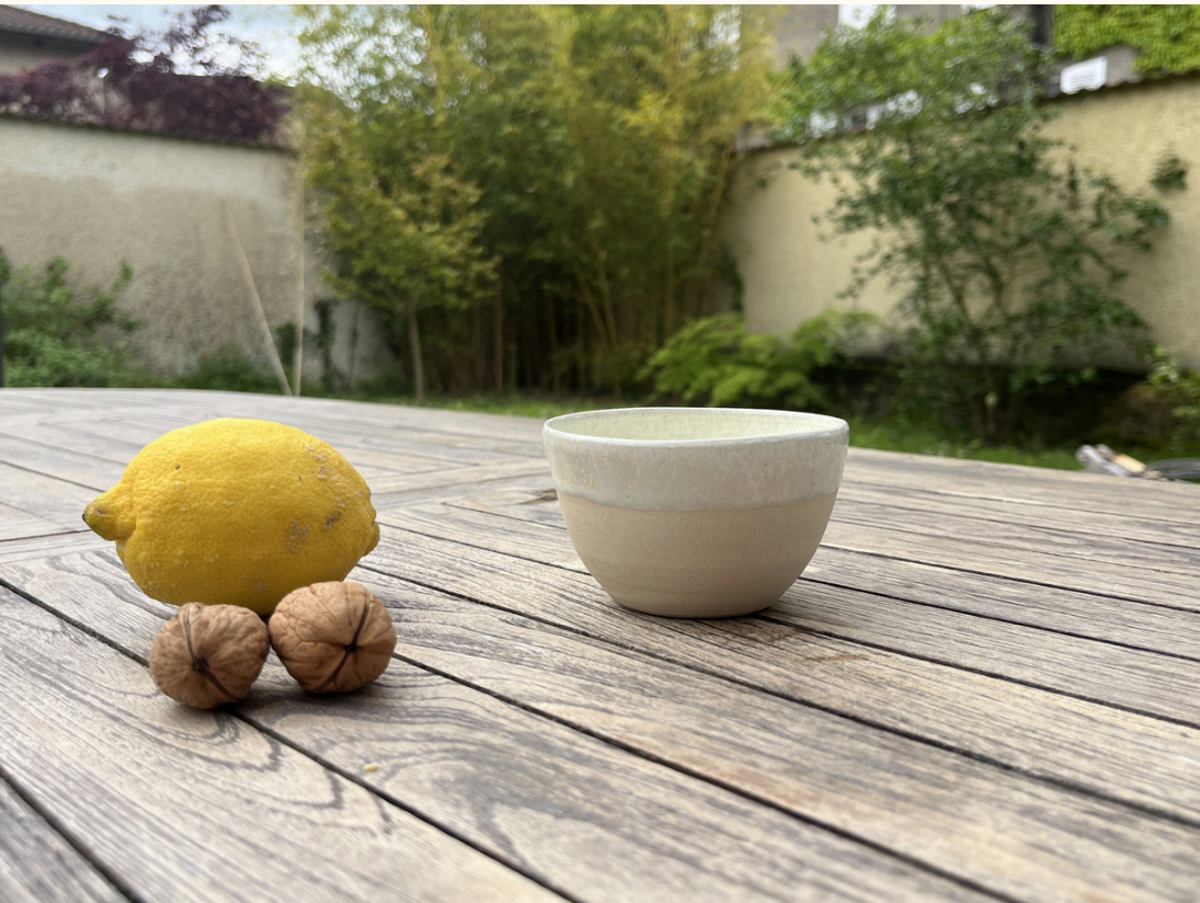
Petit bol 14€ D 10 cm