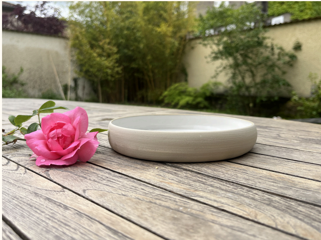
Assiette arrondie 18€ D 17 cm