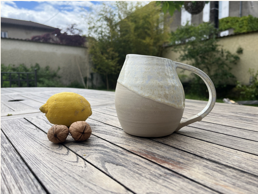
Pichet arrondie 30€ H 12 cm