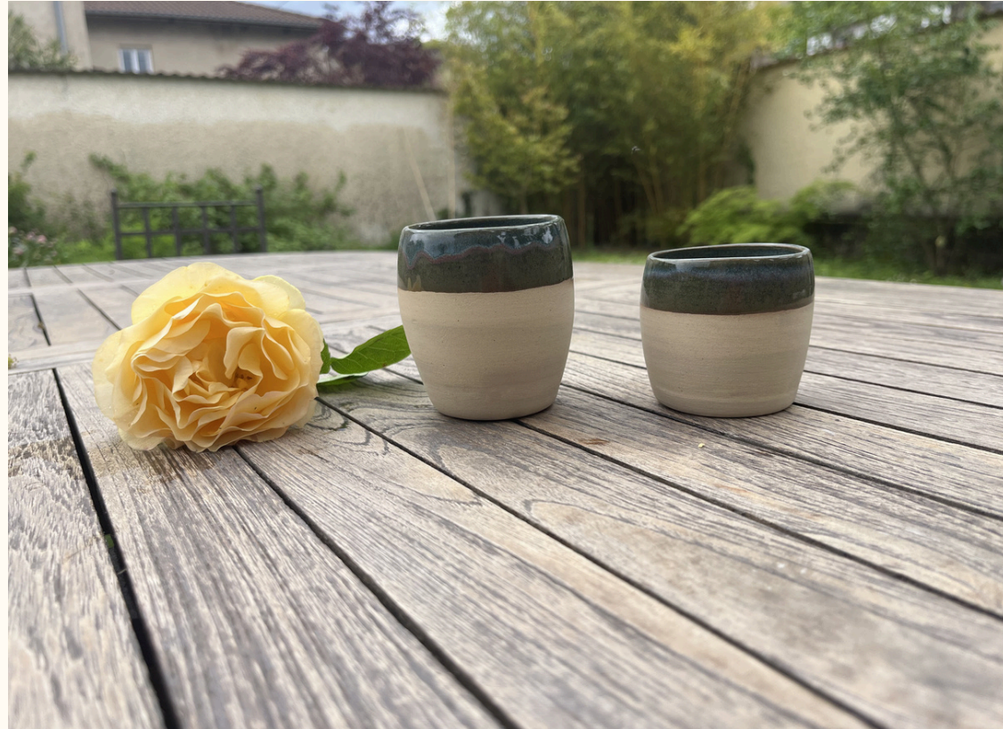
Tasse double espresso sans anse 12€ H 8 cm