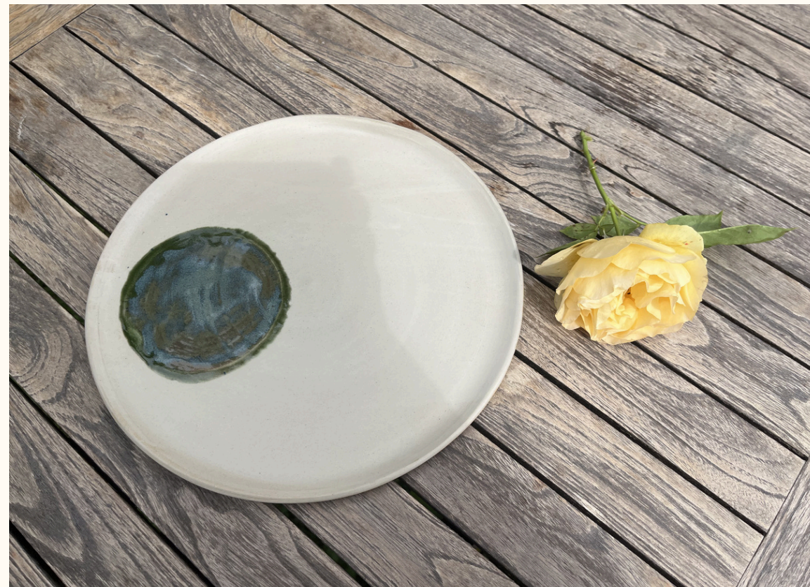
Grande assiette - plat 22€ D 26 cm