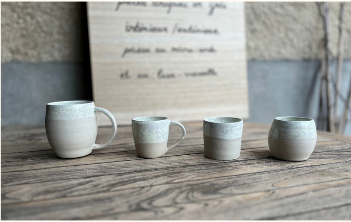
Tasse double expresso avec anse 14€ H 8 cm Tasse expresso avec anse 12€ H 6 cm Tasse expresso sans anse 10€ H 6 cm