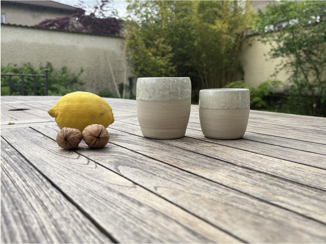
Tasse double espresso sans anse 12€ H 8 cm