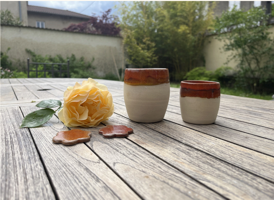
Tasse double espresso sans anse 12€ H 8 cm