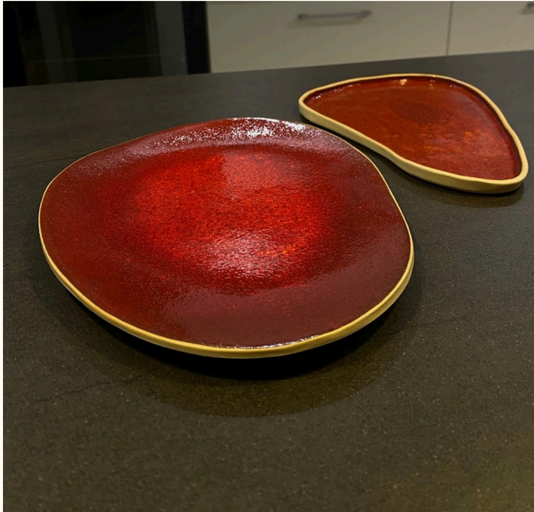
Assiette allongée 18€