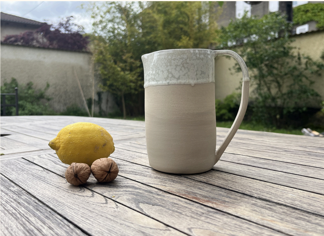
Pichet 30€ H 15 cm ou 17 cm