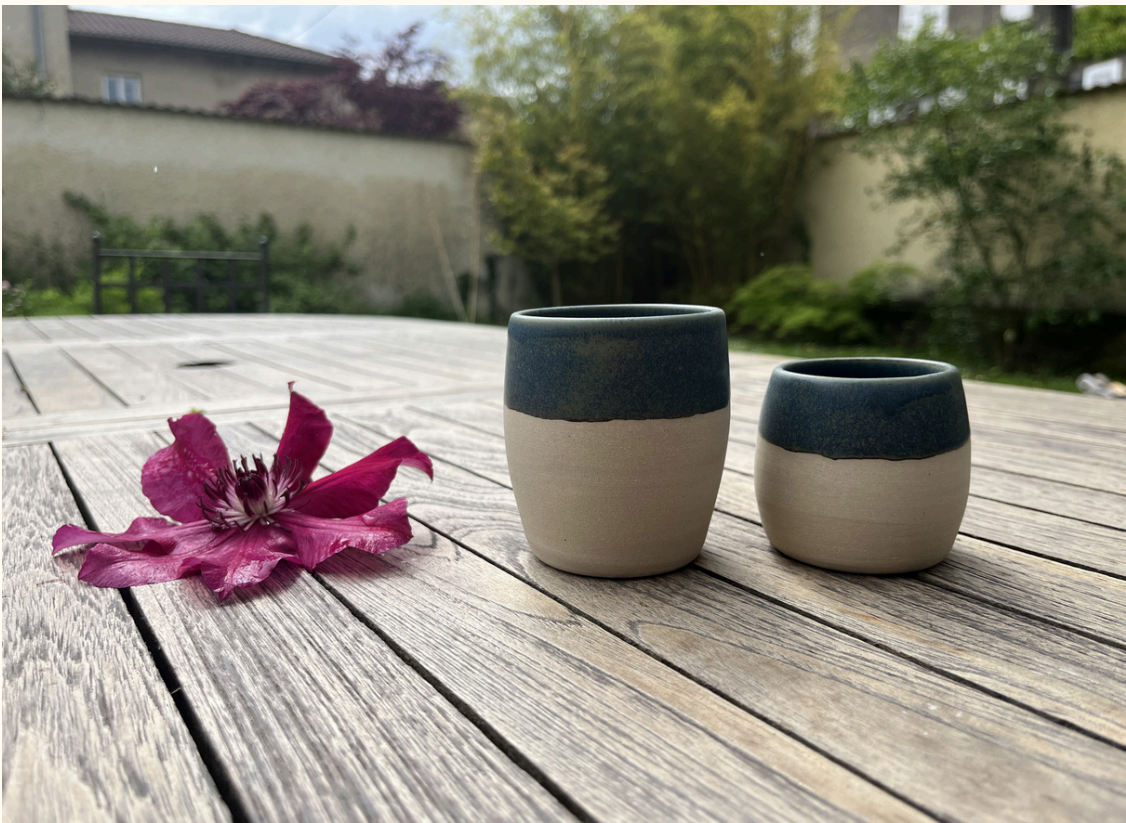
Tasse double espresso sans anse 12€ H 8 cm